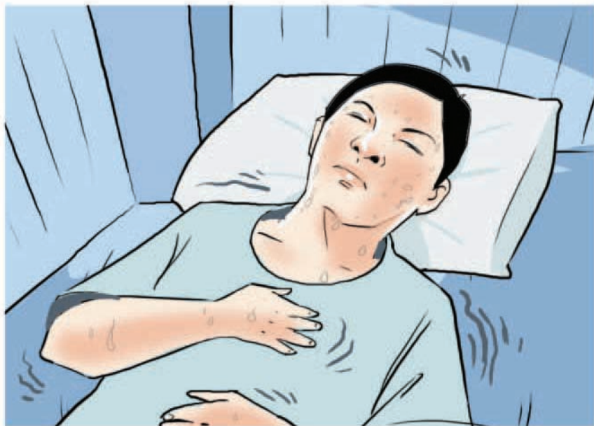
มีอาการหนาวสั่น