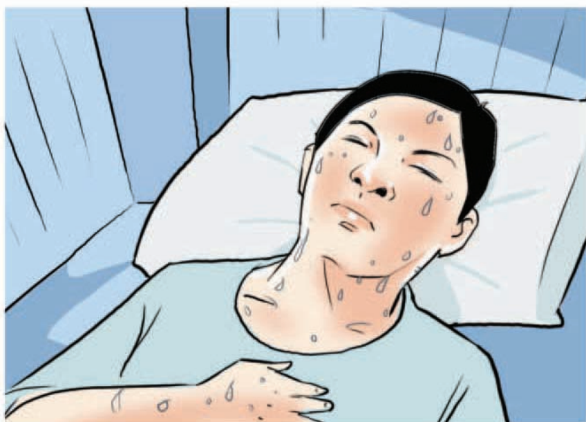
มีเหงื่อออก